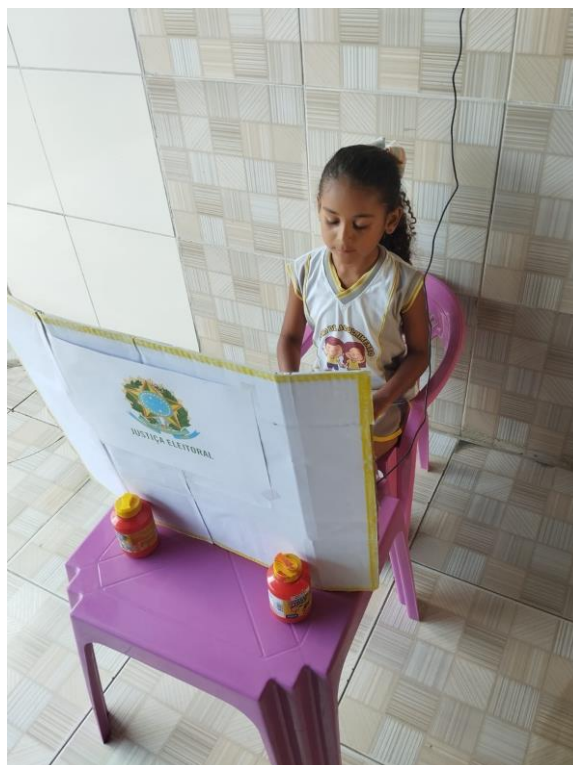
Stemmen! Zo leren kinderen iets over burgerschap en democratie

Begin oktober waren er verkiezingen in Brazilië voor burgemeester en gemeenteraad. Ook dit hebben de kinderen meebeleefd op hun manier. Dit is de mijnheer die het kiesregister controleert.