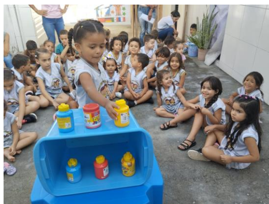
Alles in de goede volgorde leggen

Ik heb een hele serie foto's gekregen van Hosana, die goed laten zien hoe creatief men bezig is met de kinderen. Op het moment zijn er 45 kinderen die dagelijks in de crèche komen. Zoals ik al eerder gezegd heb, superbelangrijk die eerste levensperiode met een liefdevolle en creatieve begeleiding op crèche/kleuterschool met oog voor de gezinssituatie en ook met oog voor wat er in de wereld gebeurt.