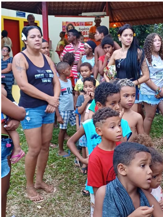
Wachten op een zak snoep

150 zakken snoep uitgedeeld. Ik weet zeker, dat dit soort feesten een dierbare herinnering zullen zijn aan de kinderjaren.