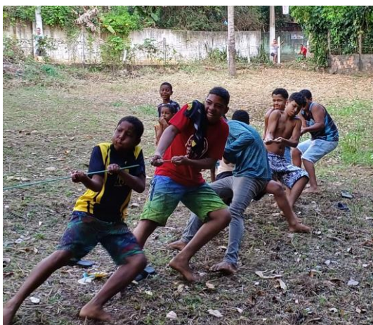
De meisjes tegen de jongens

150 zakken snoep uitgedeeld. Ik weet zeker, dat dit soort feesten een dierbare herinnering zullen zijn aan de kinderjaren.