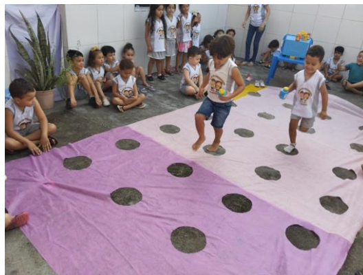
De crèche leeft mee met wat er in de wereld gebeurt, dit jaar Olympische Spelen met allerlei spellen