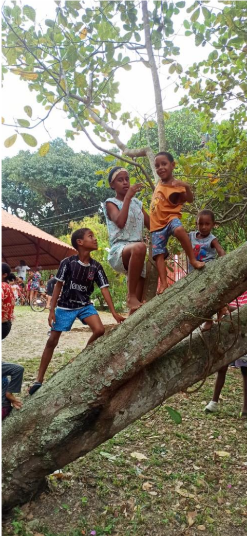
Kinderen klimmen in de Cajuboom

Voor het eerst dit jaar is deze datum, 20 november, een nationale feestdag vanwege de "consciência negra", de dag van de dood van Zumbi, leider in de 17' eeuw van de Quilombo dos Palmares, een vrijplaats van gevluchte tot slaaf gemaakte mensen.